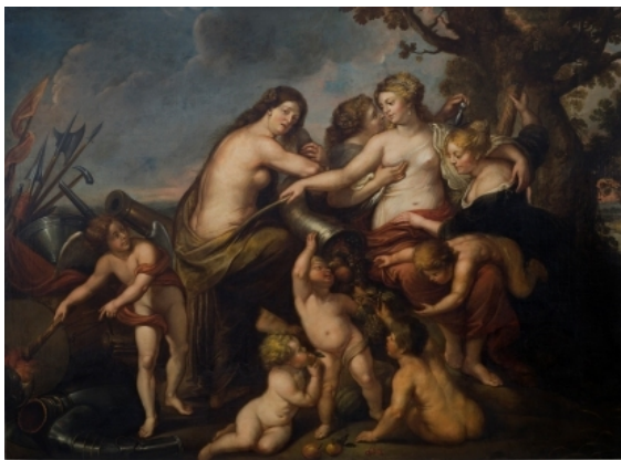
Alegoría de la Paz y la felicidad del Estado. Los clásicos consideraban la paz de un Estado como la consecuencia lógica de la justicia y el buen gobierno. Obra conservada en la Biblioteca Museo Víctor Balaguer

El Estado es una de las instituciones que perdura sin una evolución importante en su estructura y funcionamiento, con excepción de su crecimiento. El Estado moderno fue creado con la revolución industrial, pero el mundo y la dinámica de la sociedad ha cambiado mucho desde el siglo XIX. Por ejemplo, mientras las empresas modernas, que fueron creadas durante la revolución industrial, cambian ágilmente su dinámica cada vez que el mercado lo demanda, los Estados no cambian sus leyes de la misma