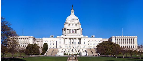
El Capitolio de los Estados Unidos.

(Nota: "estatidad" se utiliza aquí como equivalente a "estatalidad" o "estatalismo")